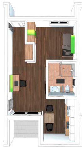
Wohnung 1.11 42,54 m 2 , 1. OG, 1,5 Zimmer, Bad, Loggia