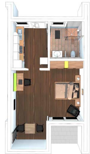
Wohnung 1.14 43,38 m 2 , 1. OG, 1 Zimmer, Küche, Bad, Loggia