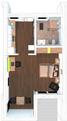
Wohnung 1.4 43,62 m 2 , EG, 1 Zimmer, Küche, Bad, Terrasse