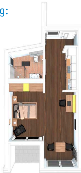
Wohnung 1.12 44,85 m 2 , 1. OG, 1 Zimmer, Küche, Bad, Loggia